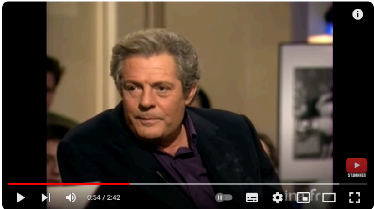
M Mastroianni & F Ardant : Le questionnaire de Bernard Pivot dans Bouillon de Culture

https://www.youtube.com/watch?v=FyrMwvmcPuc&ab_channel=InaCulture